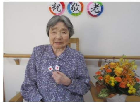
大正12年6月生まれの99歳！ 白寿のお祝いをしました。