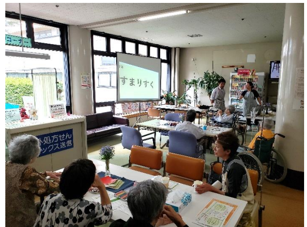
認知症予防のための脳トシ

次回開催は、 7月23日(火) を予定しております。 たくさんの方のご参加をお待ちしておりますので お気軽に足を運んで下さい♪