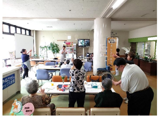
包括支援センター職員 による健康体操