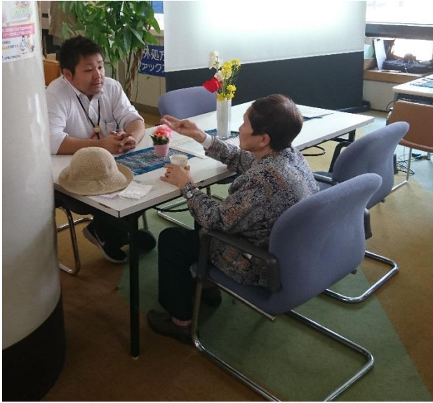
日頃の悩みや不安をお聞きしました