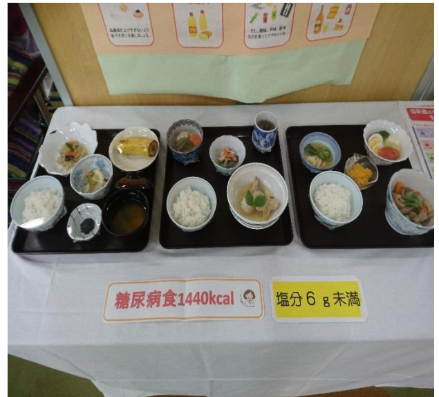
糖尿病に配慮された食事の献立