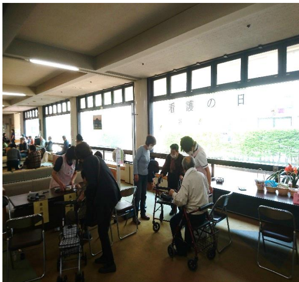
看護師による健康チェック