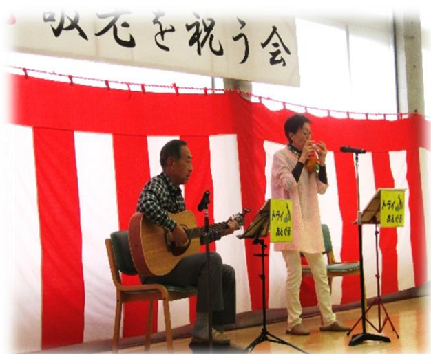
28日(木) トライあぐる 様