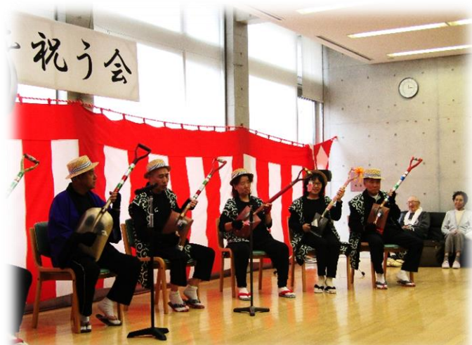
28日(木) スコップ三味線「花の会」様