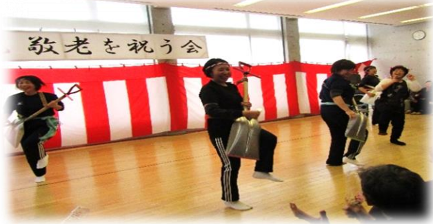
介護サービスセンターひない 『ス Copp 三味線』