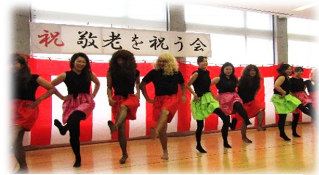
比内町福祉センターデイサービス 『ラインダンス』