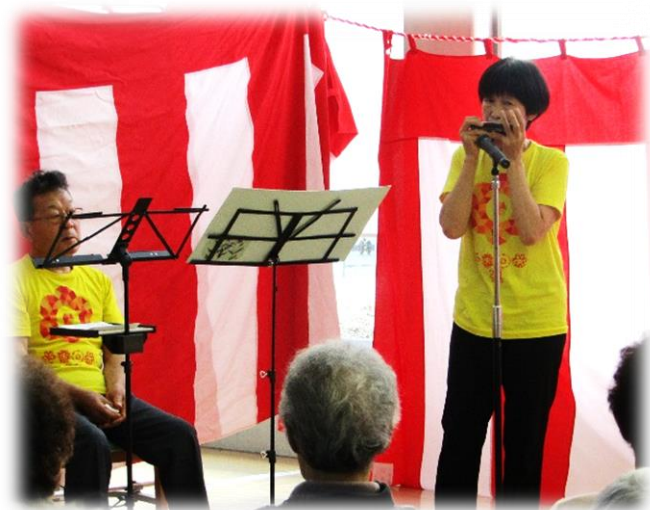
24日(日) ハーモニカ ASB たんぽぽ 様

敬老を祝う会では、 多くの方々の協力を得て 日替わりで様々な アトラクションを行いました