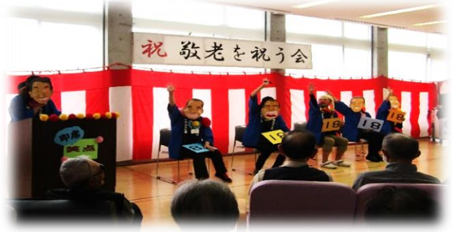
指定居宅介護支援事業所ひない 『即席笑点』