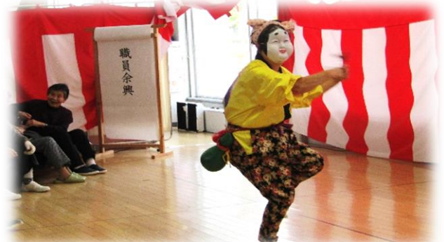
大館市地域包括支援センター扇寿苑 『ひょっこり踊り』