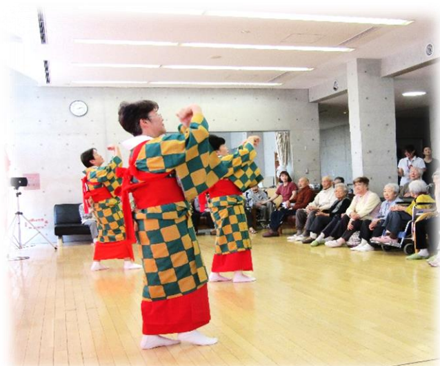
26日(火) 大館民踊同好会 様