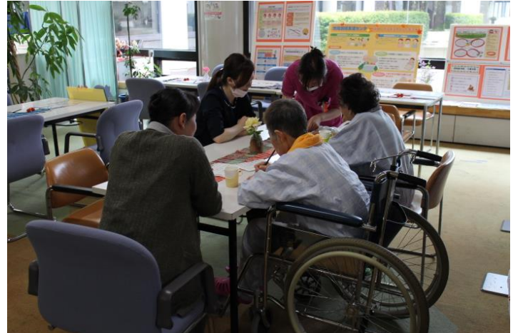
扇田病院の入院患者様も立ち寄られました