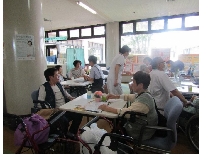
多くの方に立ち寄っていただきました