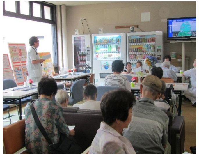
「認知症と物忘れの違いについて」

今後も、扇田病院との連携を図りながら定期的を開催していきたいと考えております。次回開催は9月を予定しております。地域の皆様の多数のご参加をお待ちしております。