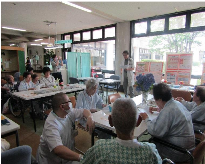
大本医院長によるミニ講話