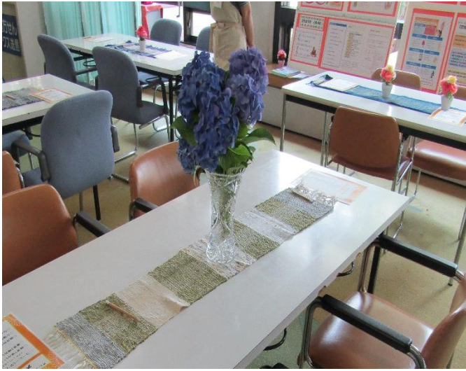
季節の草花が会場を彩ってくれました