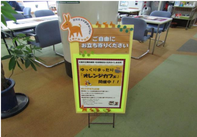
手作り看板が会場を彩ってくれました