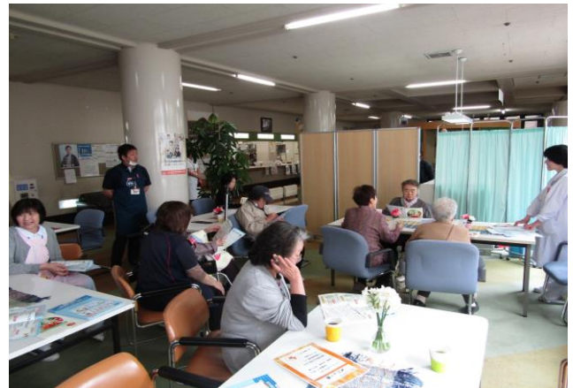
「認知症にならない為の食事について」