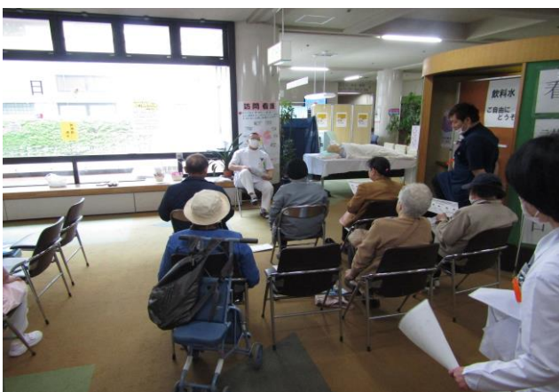
「院内看護の日」 座ったままでもできる体操