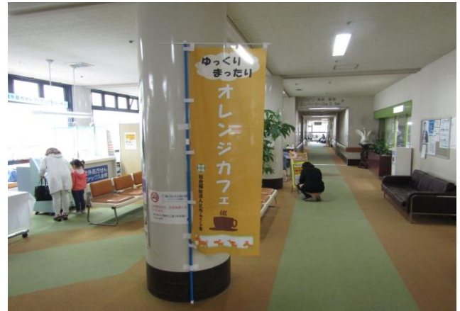
初登場「のぼり」も完成しました