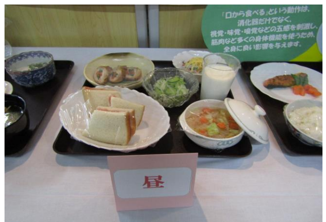
「院内看護の日」 バランスの良い食事の展示

今後も、扇田病院との連携を図りながら定期的に行っていきたいと考えております。次回開催の際は、地域の皆様の多数のご参加をお待ちしております。