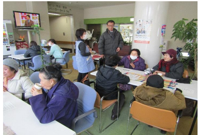
参加者同士の交流も見られました