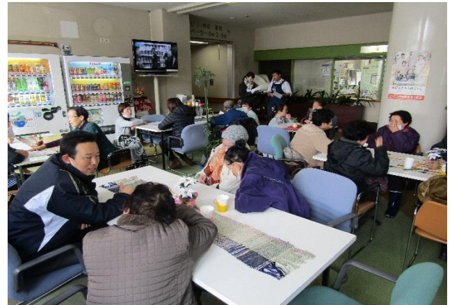
認知症と物忘れの違いなどを説明