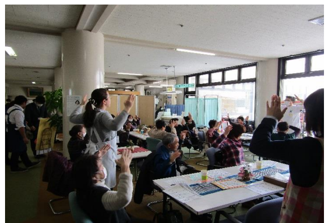
肩こりの予防・改善体操

今後も、扇田病院との連携を図りながら定期的に行きたいと考えております。次回開催の際は、地域の皆様の多数のご参加をお待ちしております。