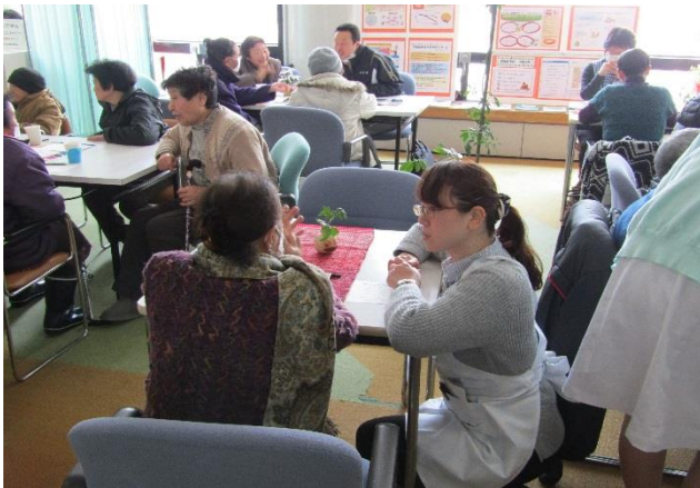
専門職と気軽に交流できます