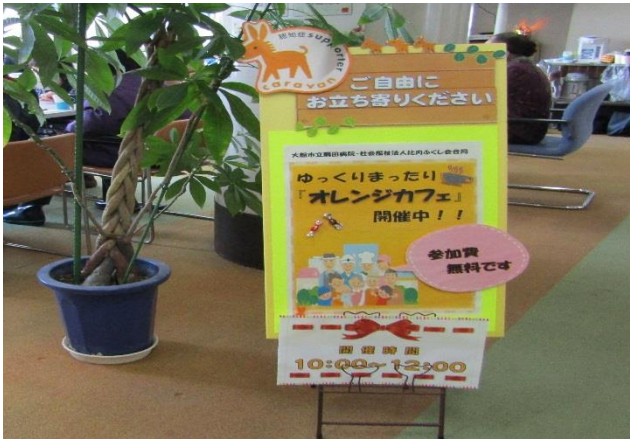
手作り看板が会場を彩ってくれました